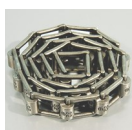
Удлинитель цепи 1м