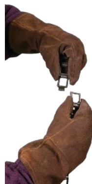
Звенья цепи можно отрегулировать по диаметру труб.