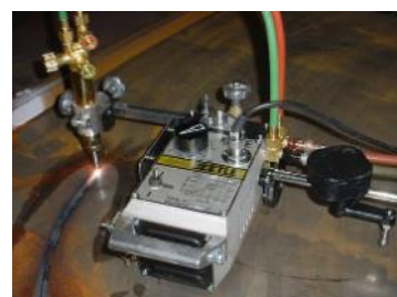
Accessoire de coupe en cercle