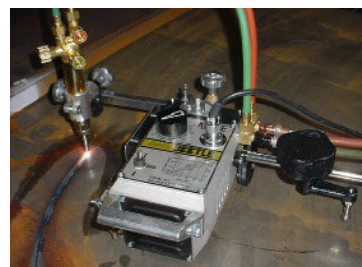
Устройство для резки кругов